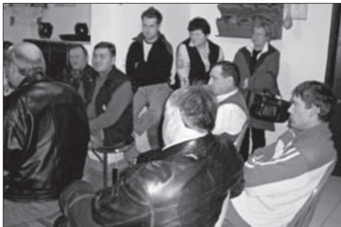
Ljudje so pokazali zanimanje za asfaltno cesto.

toliko ljudi, saj to pove, da je zainteresiranost krajanov velika in si želijo asfaltirane ceste. Eden izmed svetnikov je poudaril, da je vesel, da vidi toliko zanimanja, in potrdil, da nove asfaltirane ceste pomenijo izboljšanje življenja in prinesejo napredek v kraj. Vsekakor so ljudje, ki živijo tukaj, pokazali nezadovoljstvo, saj se nekateri spominjajo, kako je nastajala ta cesta, in zelo so razočarani, da so ravno tukaj, v Veliki Varnici, vedno na »zadnjem mestu«. Po dolgi razpravi so izvolili iniciativni