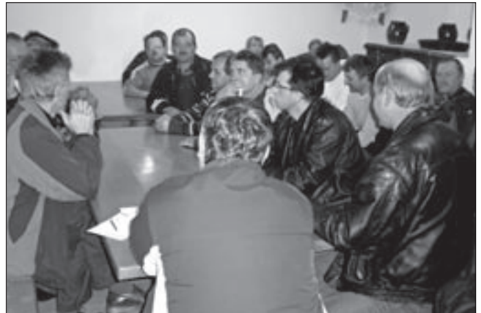
Zbrani udeleženci sestanka

se vsakodnevno vozijo po tej cesti in asfaltirano cesto nujno potrebujejo. Vedno več je turistov, ki obišejo te kraje in se podajo na romanje do svetega Avguština, pa tudi policijske patrulje vsakodnevno po večkrat prevozijo to cesto. Tudi šolski avtobus vozi po njej. Cesta je zelo obremenjena. Ljudje so izrazili nezadovoljstvo, predvsem zato, ker na cesto čakajo že dlje časa. Kot jim je omenil župan, bo zelo težko v letu 2009 asfaltirati ta odsek ceste. Vsekakor je bilo pohvalno, da se je zbralo