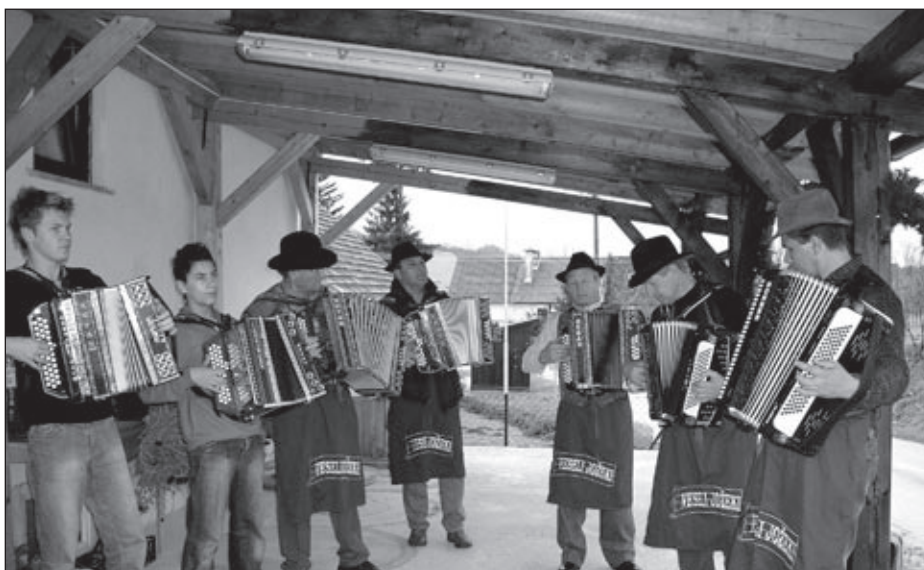
Na slovesnosti so zaigrali tudi Veseli Jožeki.