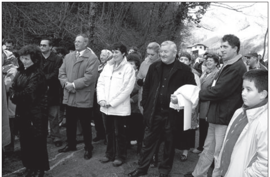
Na slovesnosti v dolini pod Skorišnjakom se je zbralo veliko ljudi.

najprej modernizirati cesto, potem pa graditi vodovod, so se dogovorili v KS in občini.