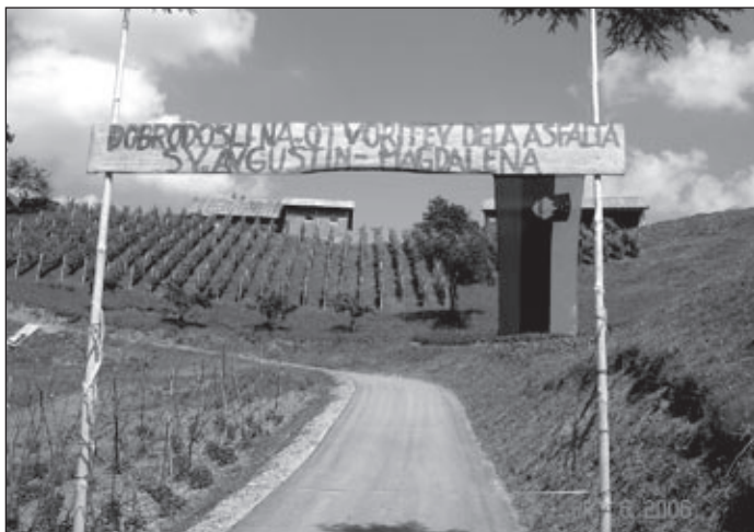
Letos poleti so tudi v Veliki Varnici slovesno odprli odsek asfaltne ceste.