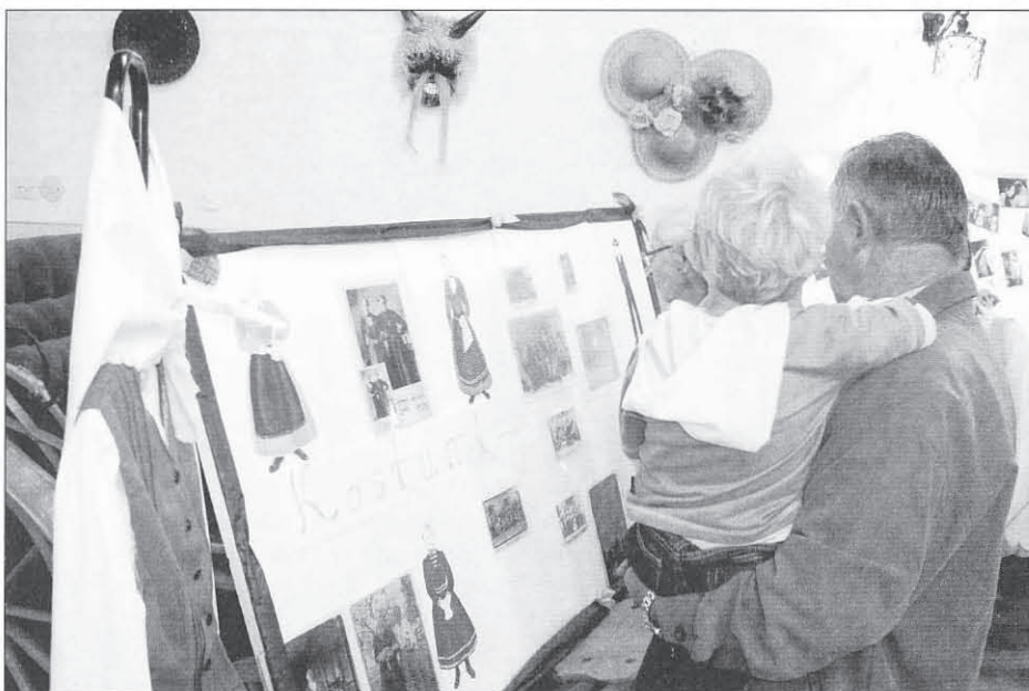
Nekateri so si z velikim zanimanjem ogledovali tudi stare fotografije, ki bogatijo kroniko folklornega društva.

Slavnostnemu koncertu so drugi dan praznovanja dodali še folklorno druženje z gosti od vsepovsod; tako so se Rožmarinovcem na odru pridružile folklorne skupine iz Markovcev, Cirkovc, Lancove vasi, Destrnika, KUD Študenta Maribor in Bolnišnice DPD Svoboda Ptuj, ljudske pevke iz Sel, ljudski pevci DU Dolena,