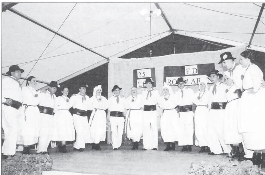
Rožmarinovci v slavnostnem večeru ...

V letu 1983 so v sekcijo pritegnili še odlične ljudske pevce, ti pa so svoje nastope obogatili s prikazom najrazličnejših del - značilnih za Haloze. Tako so velikokrat spomnili na delo v vinogradu, opevali so žetev, v pesmi obudili spomin na korpoletača, pa na domače koline, fašenk