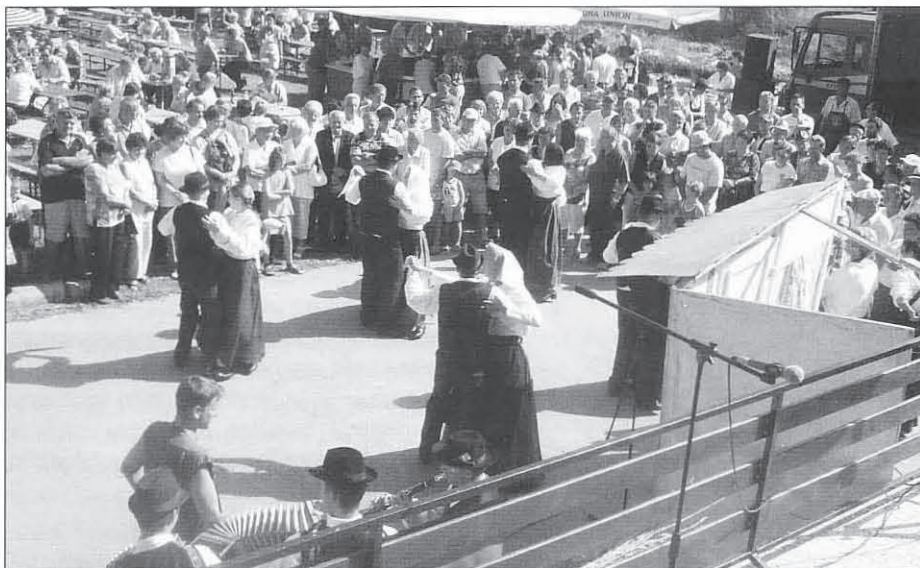
Folkloristi z Destrnika