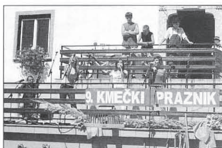
Radijska delavnica znancev v živo iz Leskovca