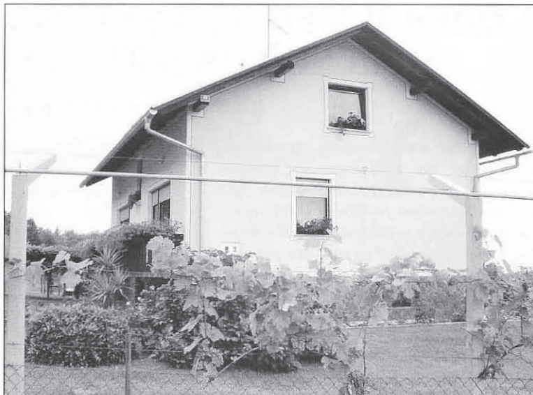
Družina Kardinar iz Zg. Pristave ima letos najlepše urejen dom.