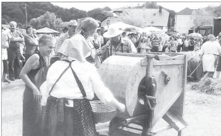
Z vetrnjakom so včasih ločevali zrnje od plev.

Istega dne je v okviru kmečkega praznika v Leskovcu gostovala tudi znana Radijska delavnica znancev, oddaja Radia Maribor.