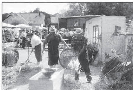
S škopanjem so pripravljali kritino za strehe.