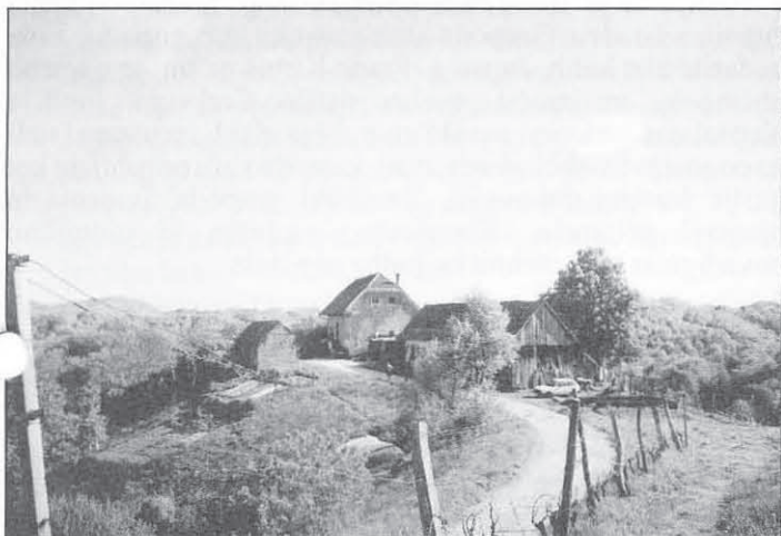
Pogled na eno haloških domačij - pred 50. leti so tod snemali film