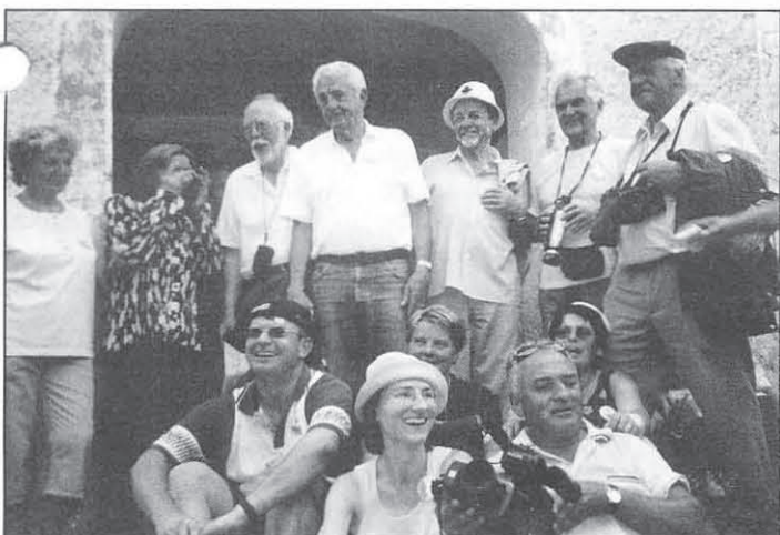
Ustvarjalci filma in organizatorji proslave