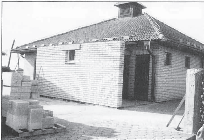
Videmska vežica je pred dnevi dobila manjši prizidek.